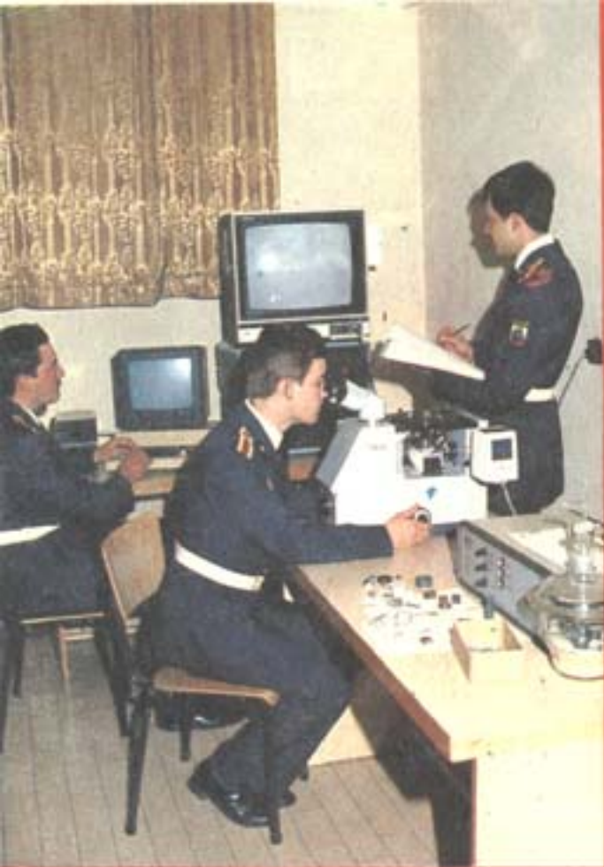
УЧЕБЕН КОМПЛЕКС ПО ЕКСПЛУАТАЦИЯ НА ЖП ТРАНСПОРТ.