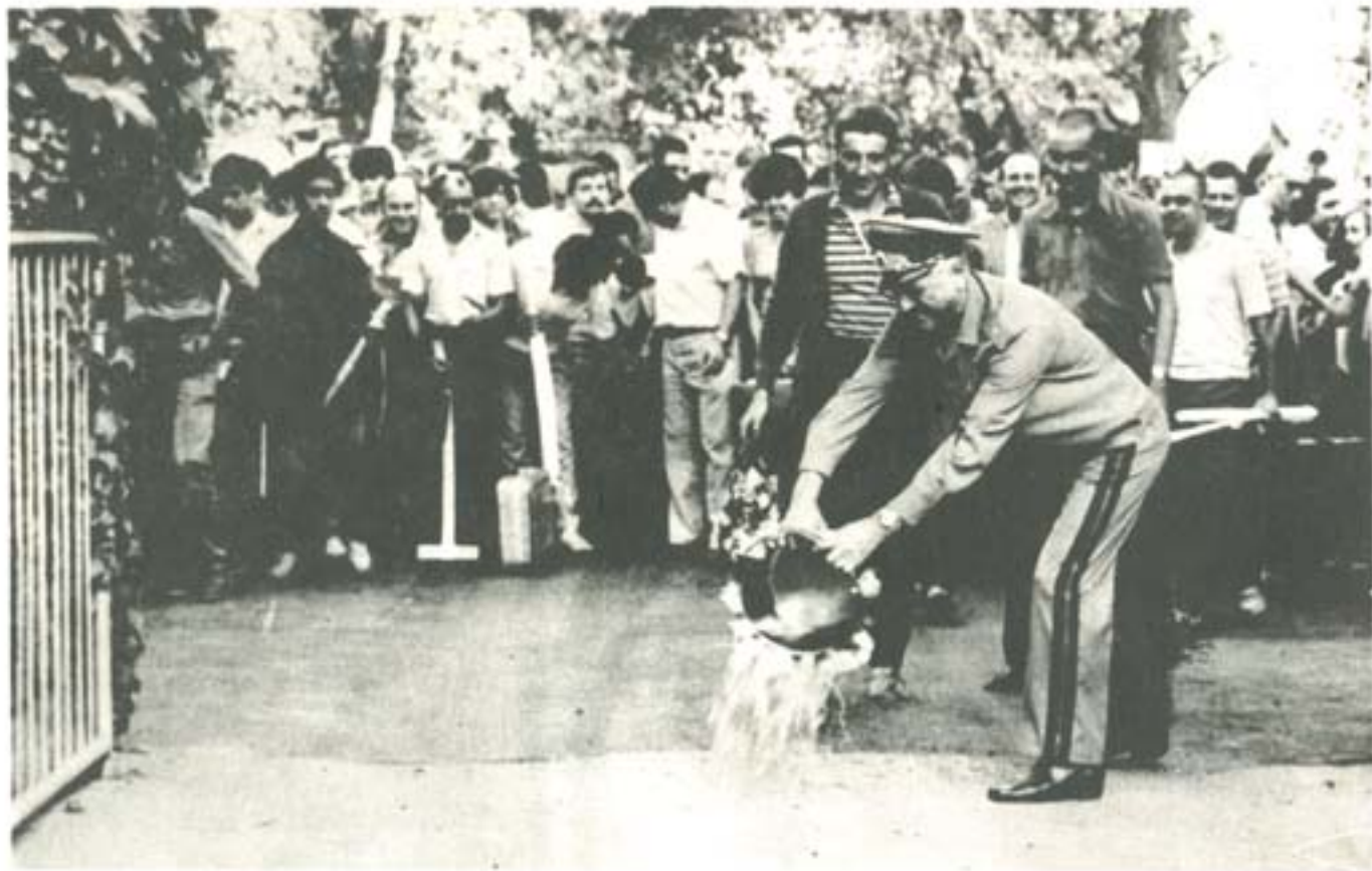
ПОСРЕЩАНЕ НА КУРСАНТИ ОТ 64 ВИПУСК