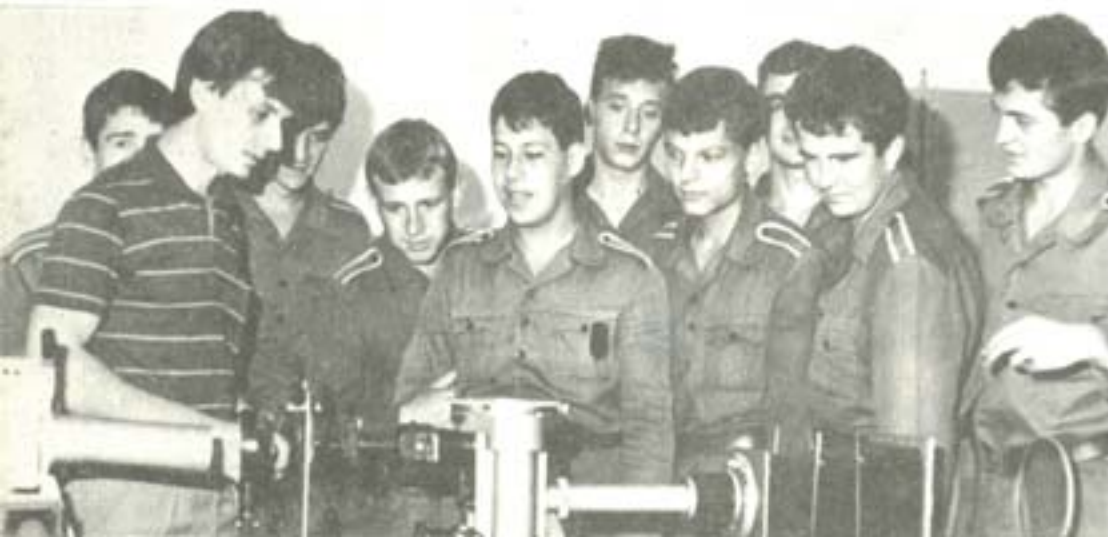
ЗАНЯТИЕ ПО МЕТАЛОЗНАНИИ.