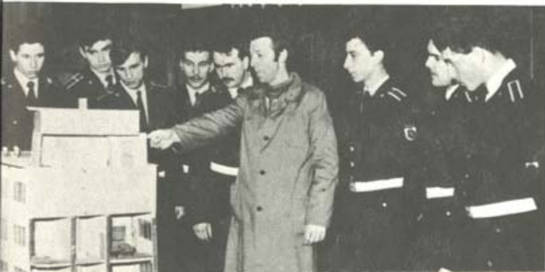
ЗАНЯТИЕ ПО УСТРОЙСТВО НА ЖЕЛЕЗНИЯ ПЪТ.