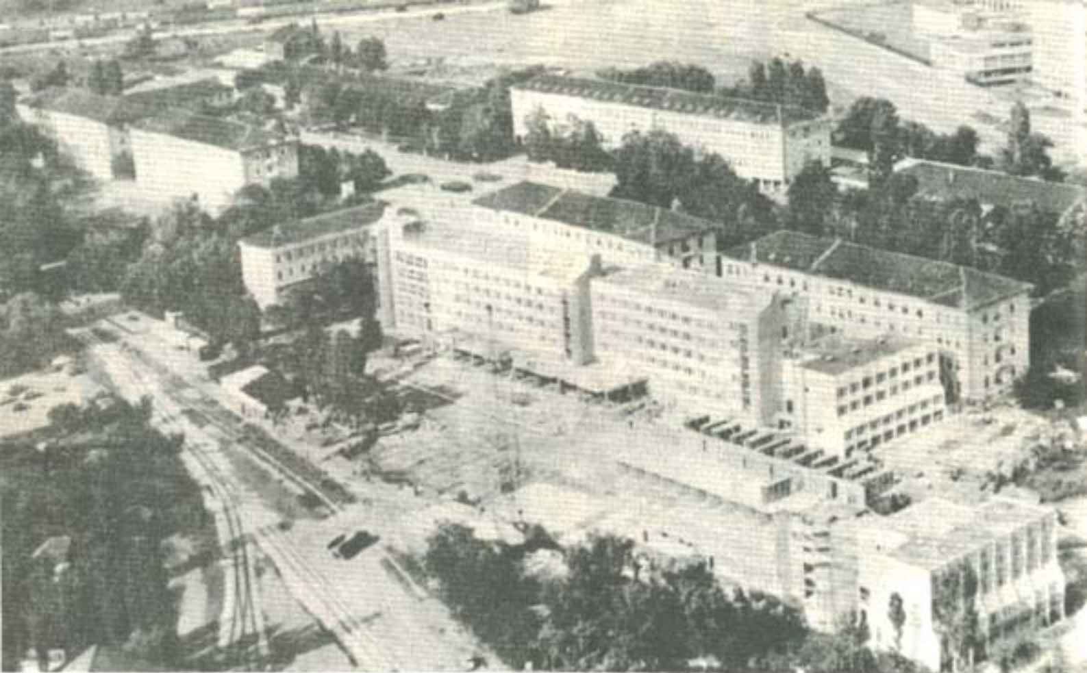
СРЕЩА НА ВИПУСКА НА 19.08.1994 Г.