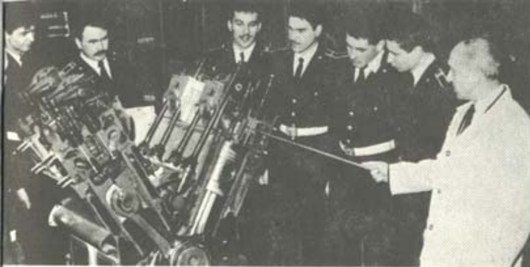
ЗАНЯТИЕ ПО ДВИГАТЕЛИ С ВЪТРЕШНО ГОРЕНЕ.