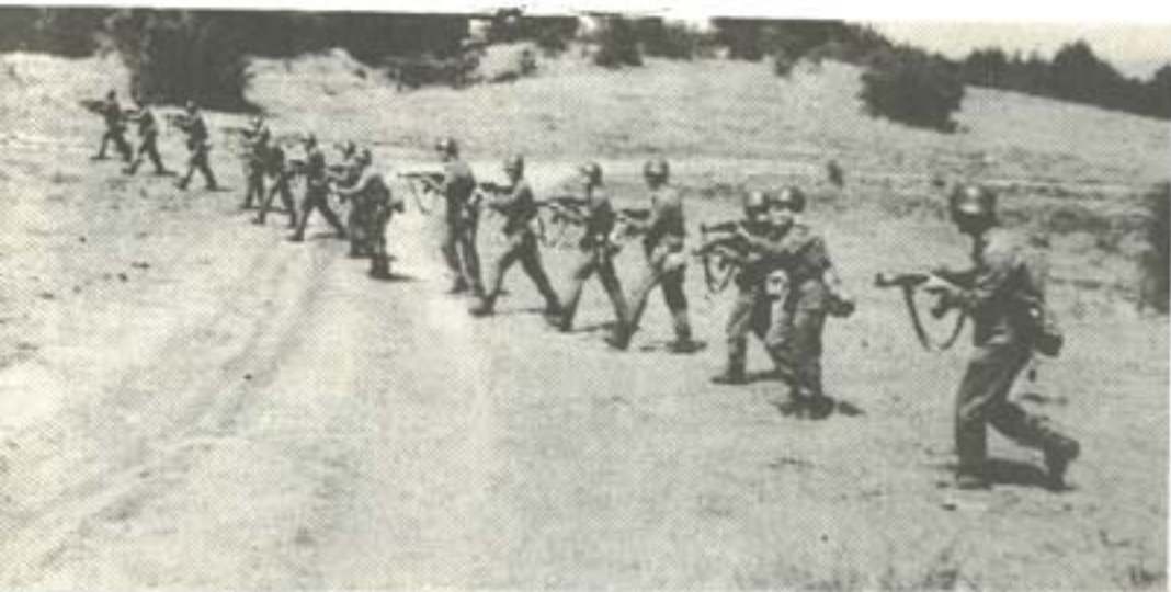
ЗАНЯТИЕ НА ПОЛЕТО.