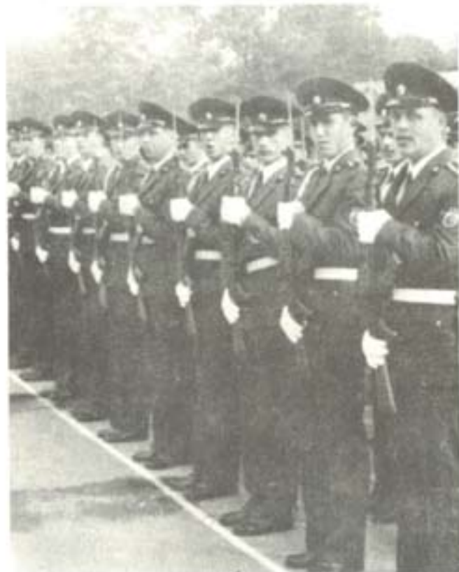
ВОЕННА КЛЕТВА НА 64 ВИПУСК