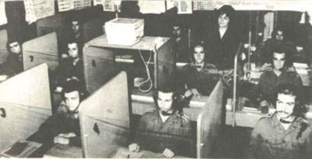
ЗАНЯТИЕ ПО РУСКИ ЕЗИК.