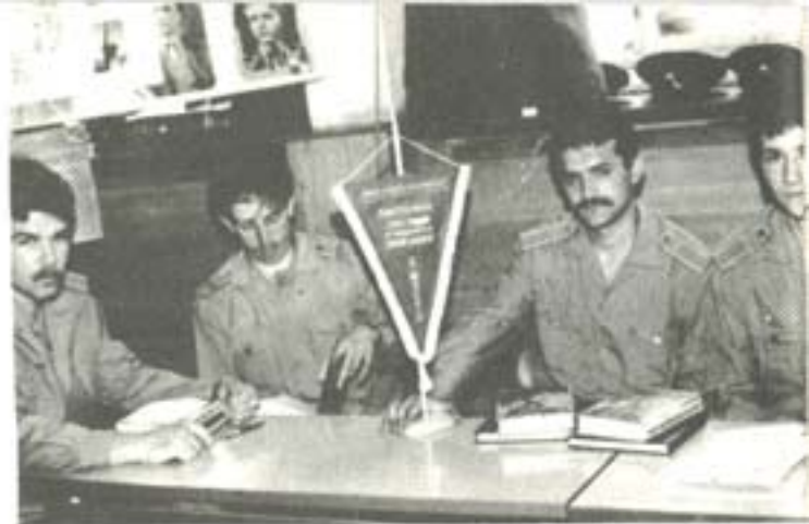
ЧЕСТВАНЕ 150 Г. ОТ РОЖДЕНИЕТО НА ВАСИЛ ЛЕВСКИ.