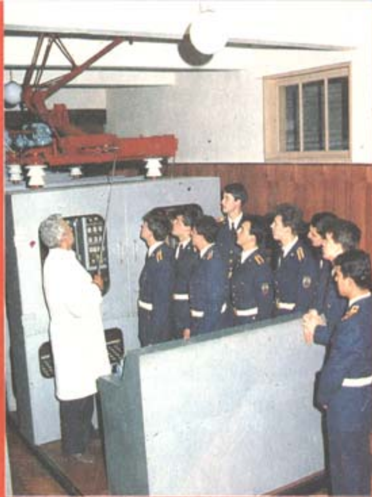
ЗАНЯТИЕ ПО ЕЛЕКТРИЧЕСКИ ЛОКОМОТИВИ.