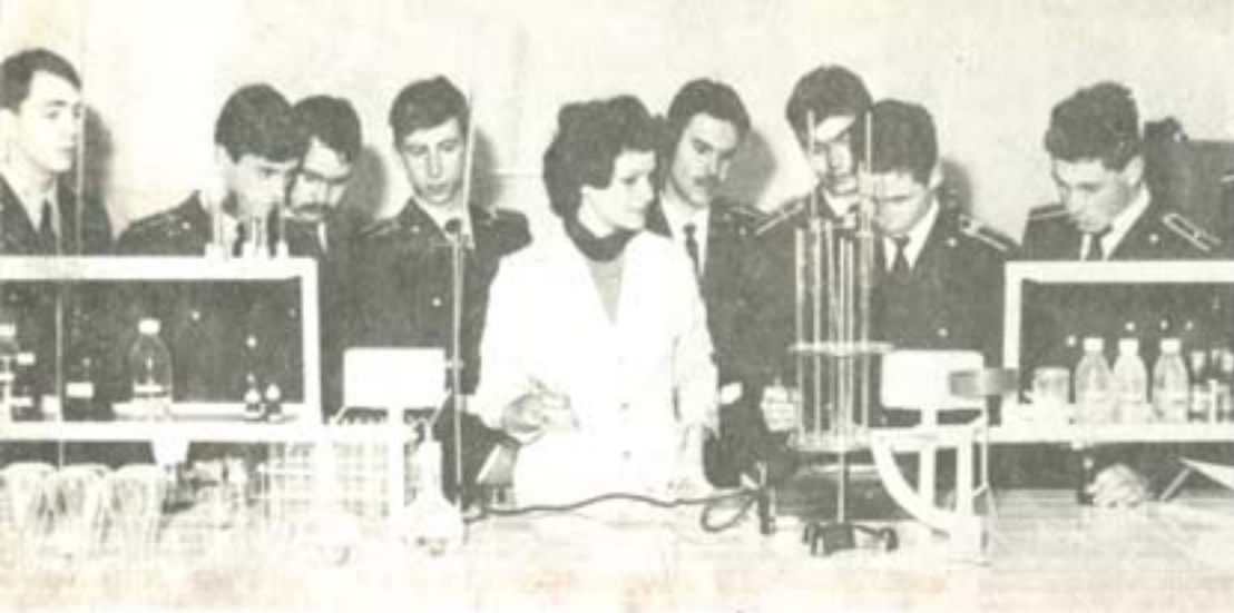
ЗАНЯТИЕ ПО ХИМИИ.