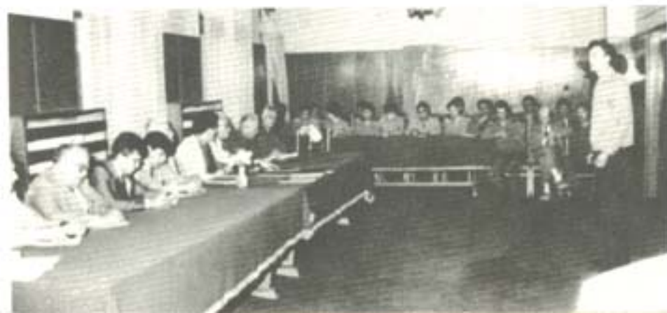
ЗАЩИТА НА ДИПЛОМНА РАБОТА