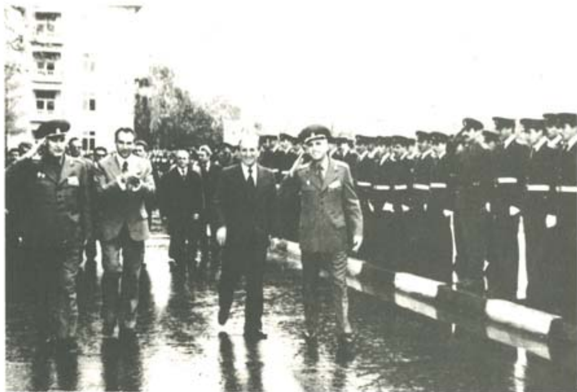
ГЕНЕРАЛНИЯ СЕКРЕТАР НА ЦК НА БКП И ПРЕДСЕДАТЕЛ НА ДЪРЖАВНИЯ СЪВЕТ НА НРВ ДР. ТОДОР ЖИВКОВ НА ПОСЕЩЕНИЕ В УЧИЛИЩЕТО – 29 АПРИЛ 1980 ГОДИНА.