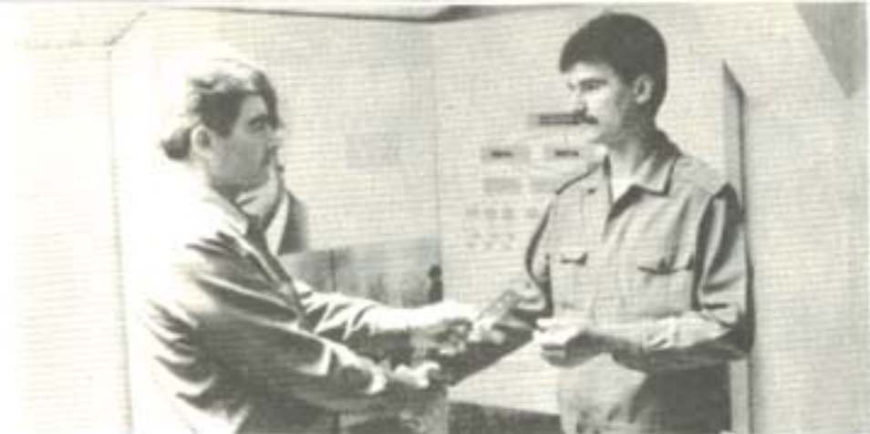
ВРЪЧВАНЕ НА ПАРТИЙНИ ЧЛЕНСКИ КНИЖКИ