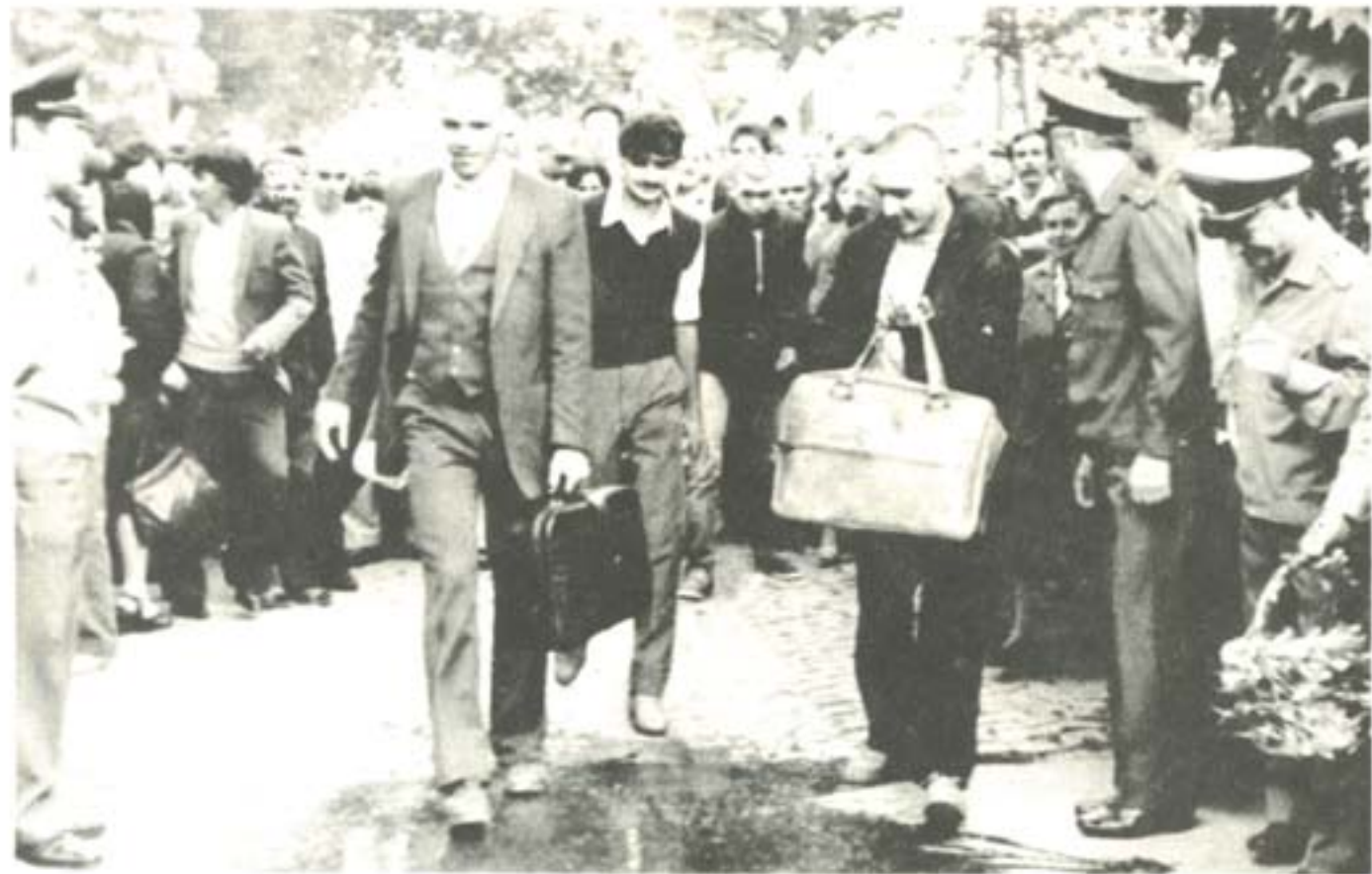
ПОСРЕЩАНЕ НА КУРСАНТИ ОТ 62 ВИПУСК