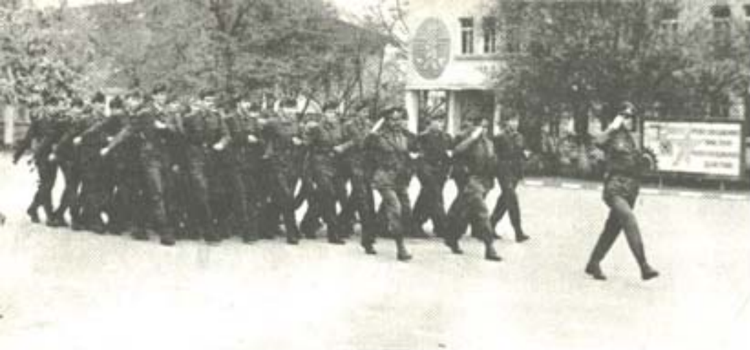
ПРЕГЛЕД НА СТРОЕВАТА ПЕСЕН.