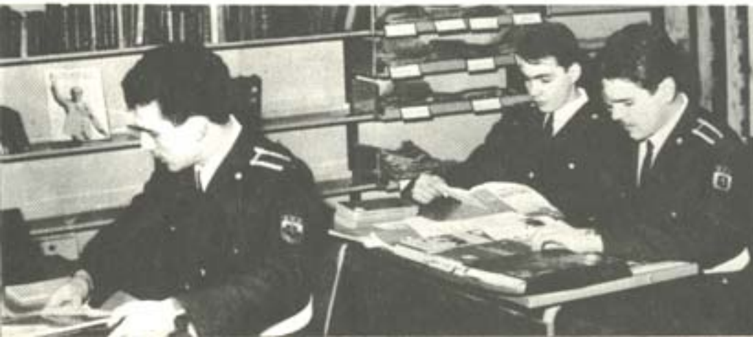
САМОСТОЯТЕЛНА РАБОТА В БИБЛИОТЕЧНИЯ КОМПЛЕКС.