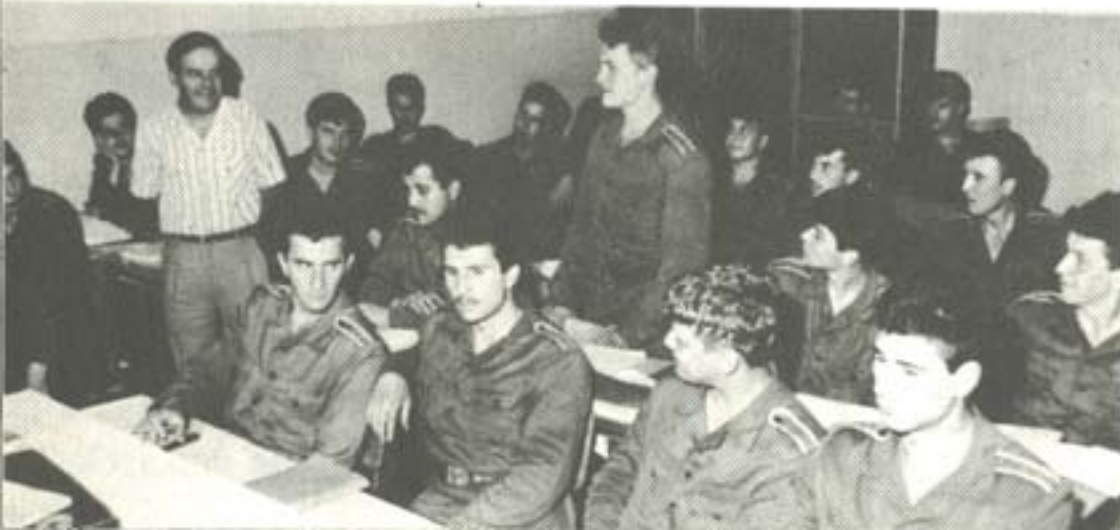
ЗАНЯТИЕ ПО ОБЩЕСТВЕНИ НАУКИ.