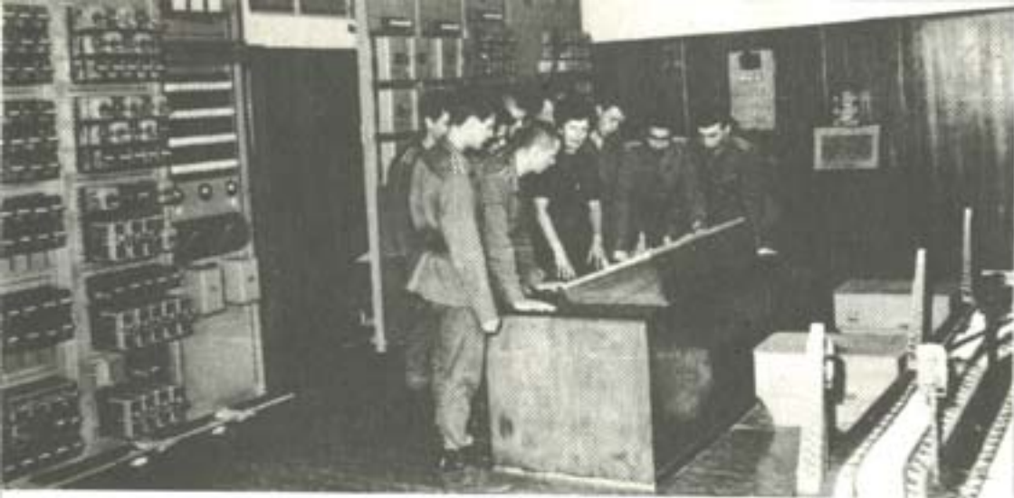
ЗАНЯТИЕ ПО СЪОБЩИТЕЛНА И ОСИГУРИТЕЛНА ТЕХНИКА И СИСТЕМИ.