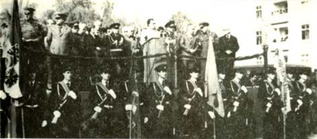
ВОЕННА КЛЕТВА НА 62 ВИПУСК